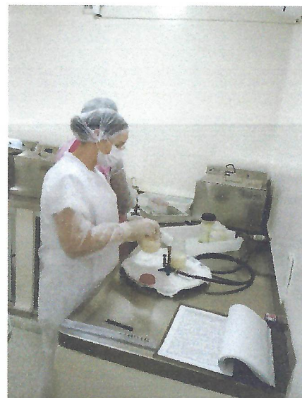
Na foto acima, auxiliar de enfermagem auxiliando a bióloga na rotina diária de pasteurização do leite humano no laboratório do BLH. Taubaté/SP.