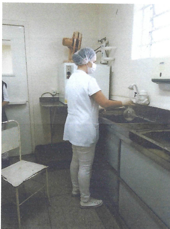
Na foto acima, a bióloga está realizando lavagem do balão volumétrico. BLH - Taubaté/SP