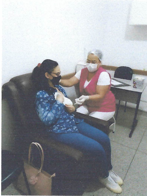
Na foto acima, auxiliar de enfermagem prestando orientações a uma mãe no BLH. Taubaté/SP.